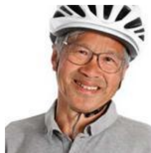
Dacfy Dzung Aktuar